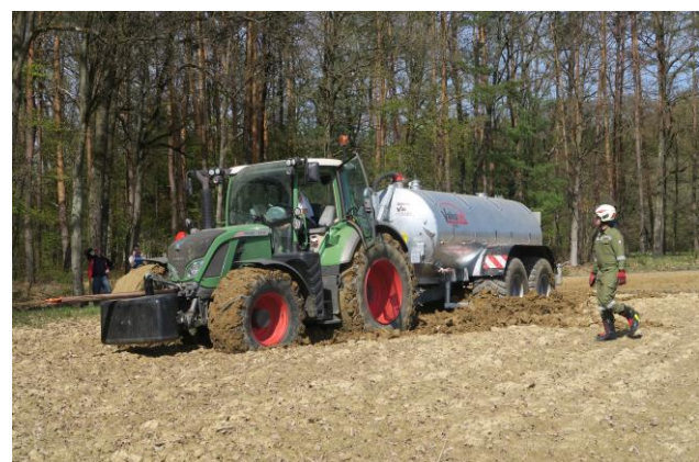
14.04.2018 – Traktorbergung in Übersbach