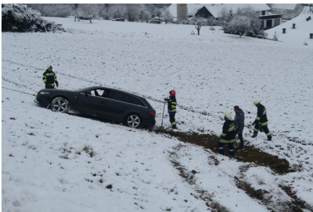
15.01.2018 – Fahrzeugbergung in Rittschein