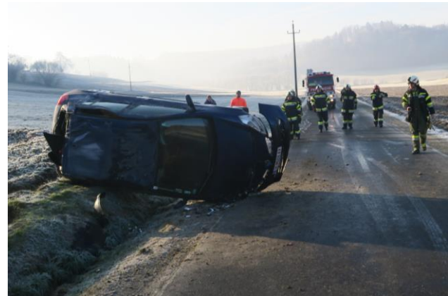
26.12.2017 – Verkehrsunfall in Oberlamm