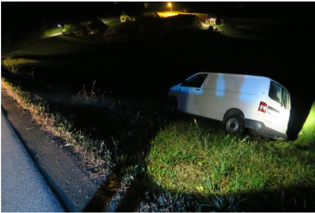
26.10.2017 – Fahrzeugbergung in Rittschein