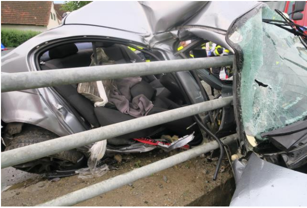
31.05.2017 – Verkehrsunfall in Aschbach (L442)