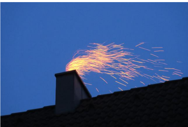
26.02.2018 – Kaminbrand in Übersbach