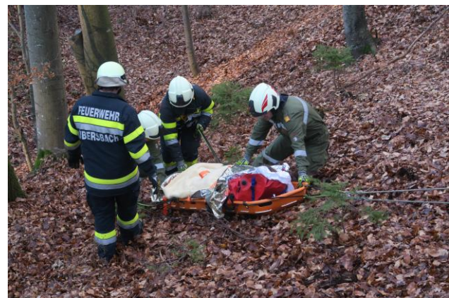
29.01.2018 – Menschenrettung in Rittschein