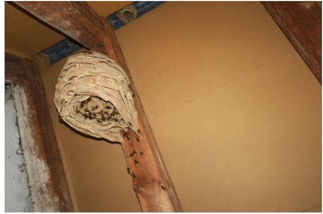
12.09.2017 – Insektenumsiedlung